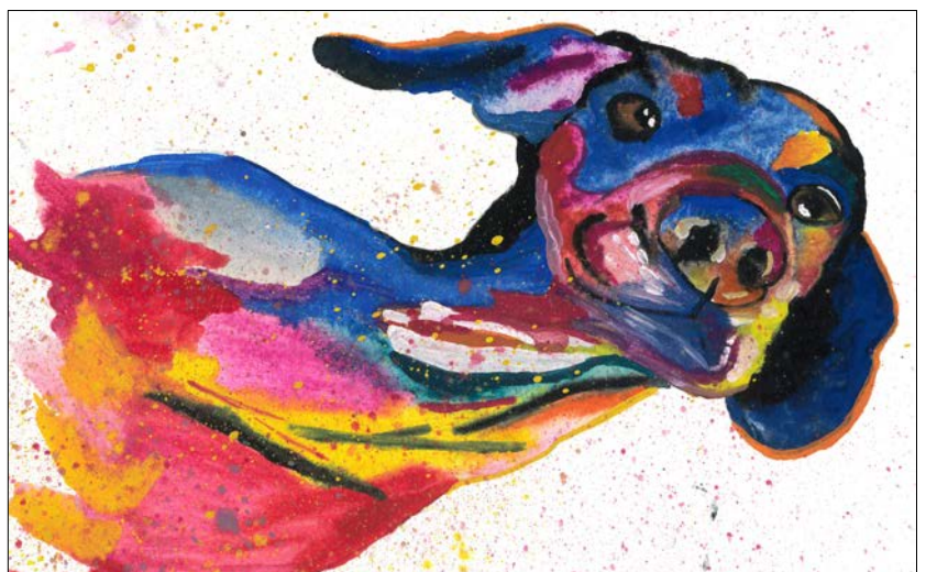
Abbildung | Arbeit aus dem Wahlfach Bildnerisches Gestalten 3. OS

Ein abwechslungsreiches und spannendes Schulleben ist uns wichtig. Nebst dem ordentlichen Unterricht sollen auch Anlässe und Events den Schulalltag bereichern. Auf unserer Homepage finden Sie einige Berichte, Beiträge und Impressionen aus unserem Schulalltag.