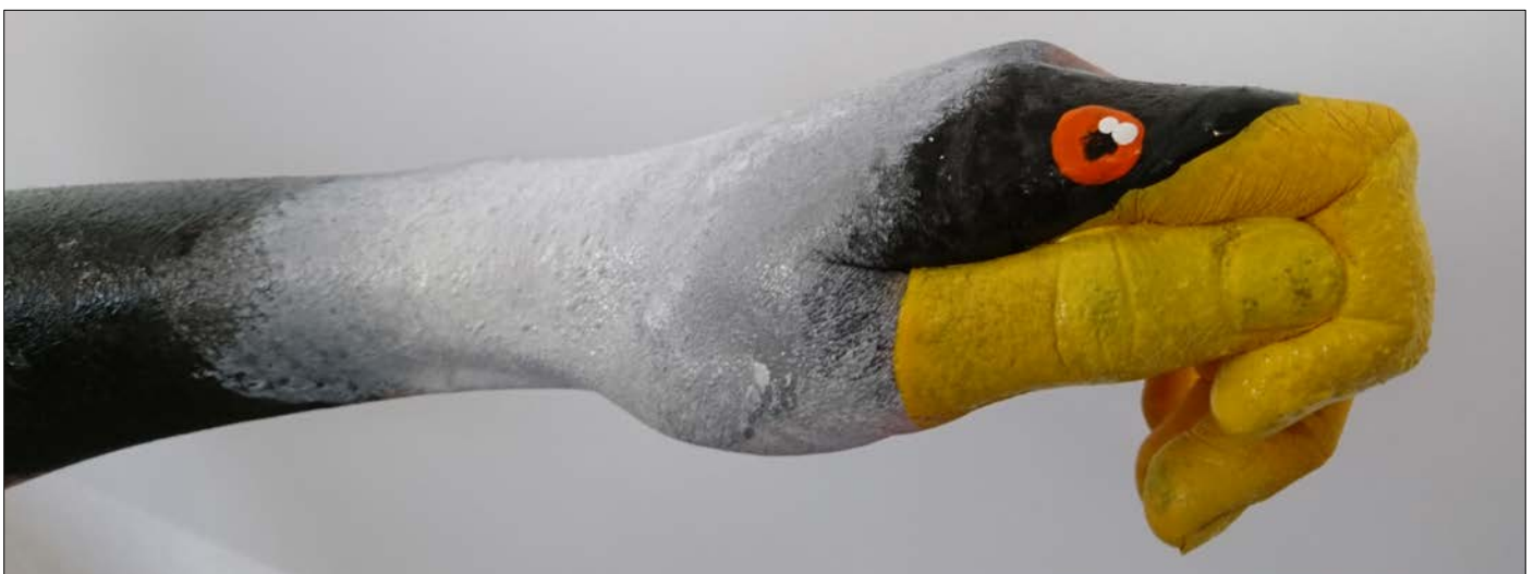
Abbildung | Arbeit aus dem Bildnerischen Gestalten 2. OS

* Am Mittwochnachmittag, 13. April 2022, 25. Mai 2022 und 15. Juni 2022 findet Unterricht statt.