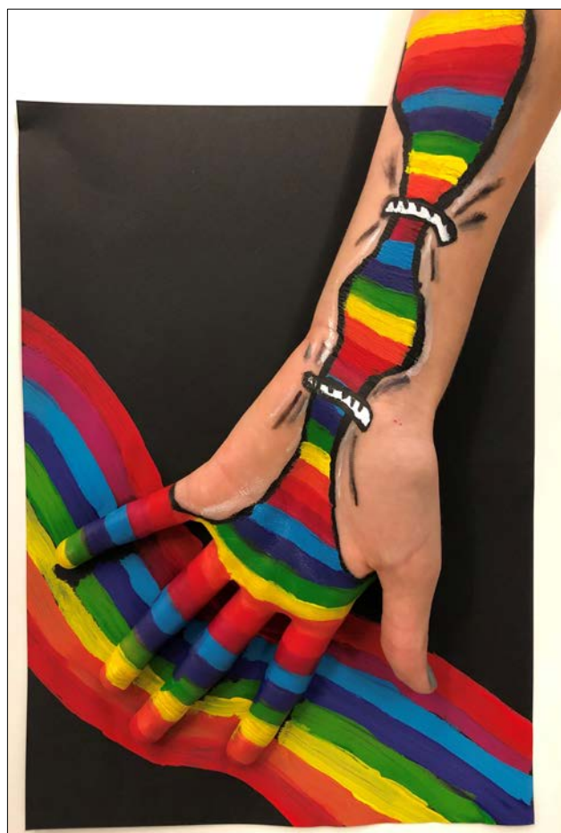
Abbildung | Arbeit aus dem Bildnerischen Gestalten 2. OS