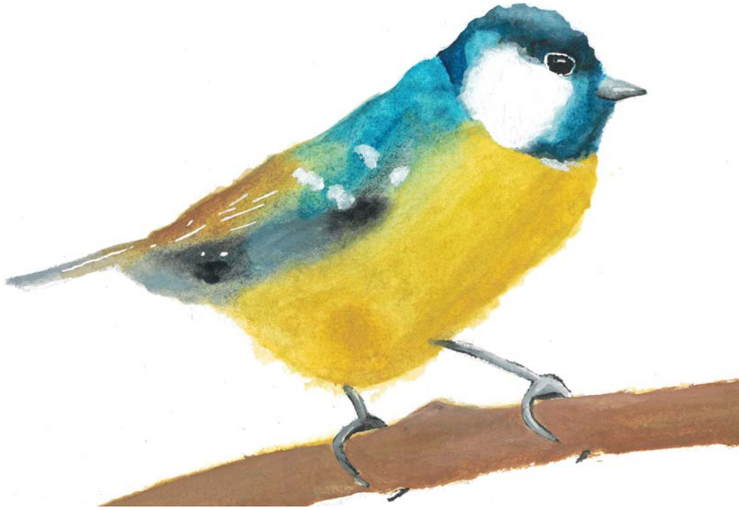
Abbildung | Arbeit aus dem Wahlfach Bildnerisches Gestalten 3. OS