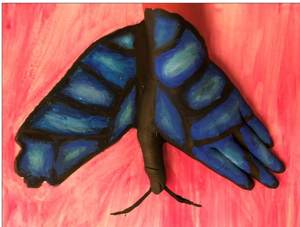
Abbildung | Arbeit aus dem Bildnerischen Gestalten 2. OS

Die App «Teams» ermöglicht eine einfache, schnelle und zeitgemässe digitale Kommunikation zwischen Schüler/innen und Lehrpersonen. «Teams» wird verbindlich auf allen drei Stufen eingesetzt.