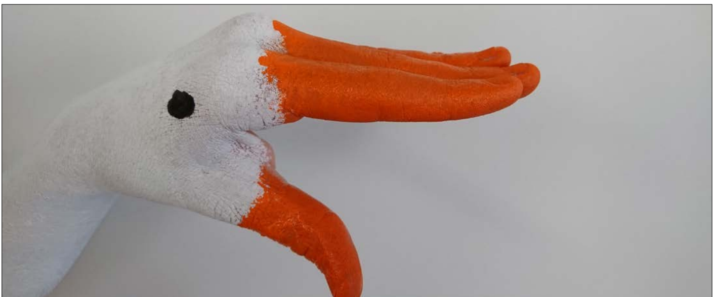
Abbildung | Arbeit aus dem Bildnerischen Gestalten 2. OS

* Am Mittwochnachmittag, 05. April 2023, 17. Mai 2023 und 07. Juni 2023 findet Unterricht statt.