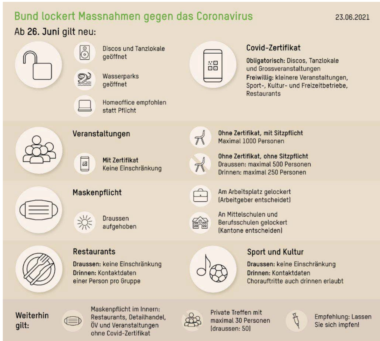
Abbildung 1: Bund lockert die Massnahmen gegen das Coronavirus