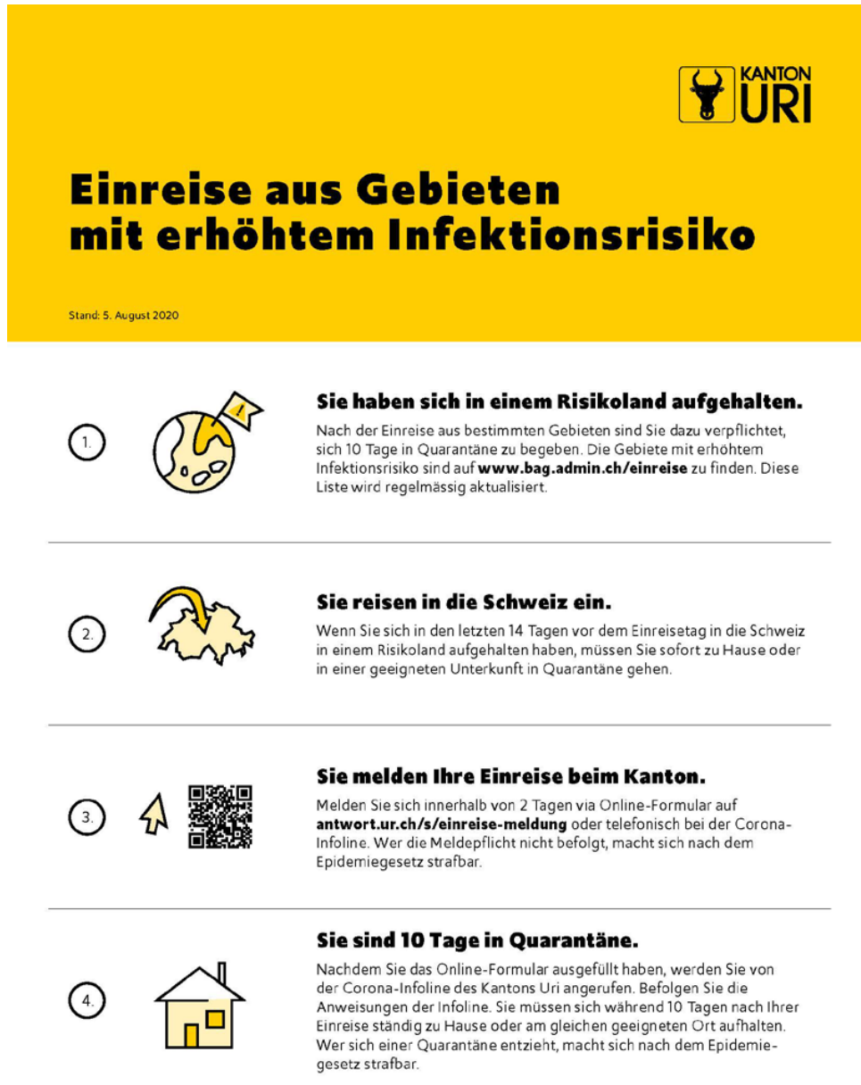
Abbildung 2 Einreise aus Gebieten mit erhöhtem Infektionsrisiko

Allgemeine Informationen unter www.ur.ch/coronavirus oder rufen Sie unsere Corona-Infoline (041 874 34 33) an.