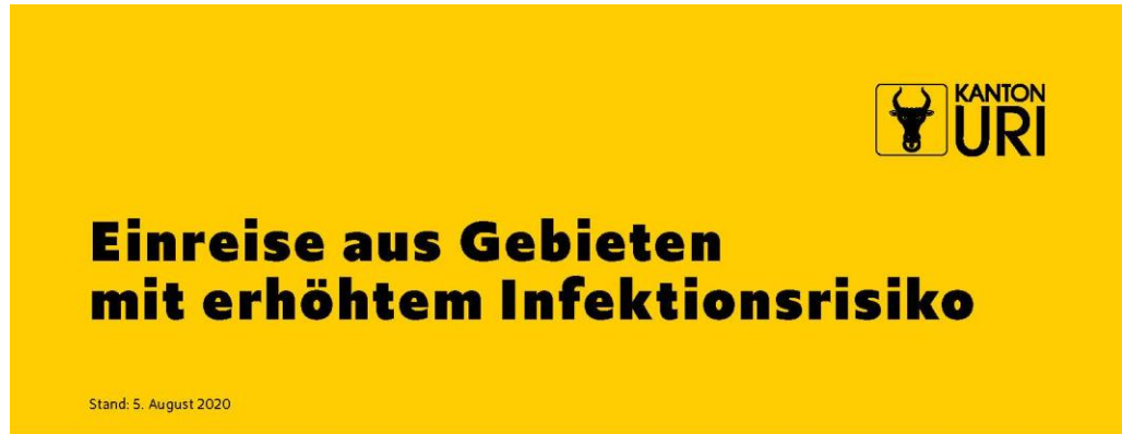
Abbildung 2 Einreise aus Gebieten mit erhöhtem Infektionsrisiko